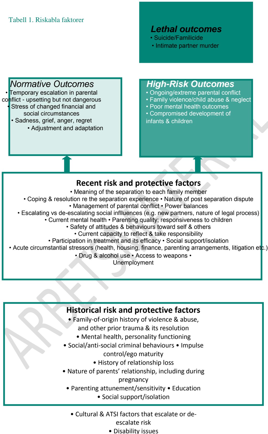
Tabell 1. Riskabla faktorer